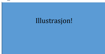
Figur 2: Tittel eller beskrivende

Note. Fra Tittel [Beskrivelse], av Kunstner, Publiseringstidspunkt, Utgiver (url). Copyright opplysning